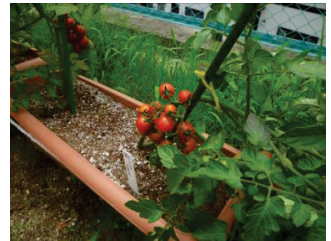
<土の中はこんなになってる>