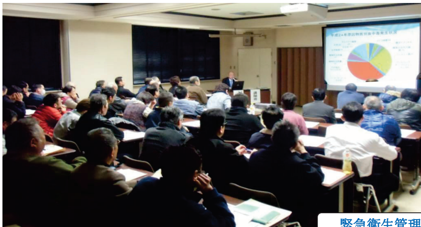
緊急衛生管理講習会